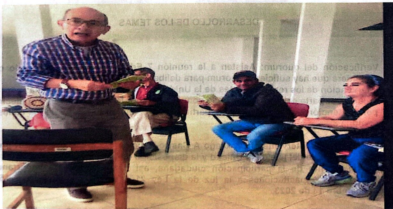
Foto: Capacitación ediles. CDC comuna 8. 6 de octubre de 2023. Hora: 8:30 a.m.