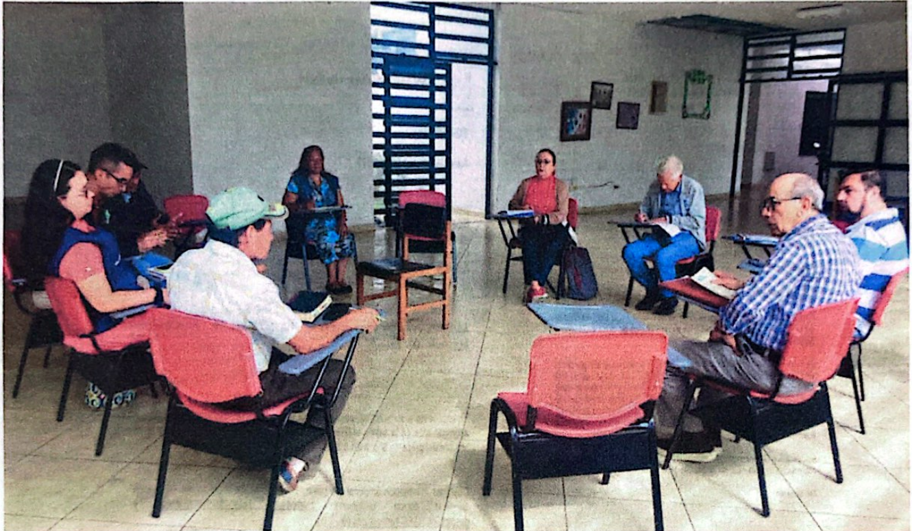
Foto: Capacitación ediles. CDC comuna 8. 6 de octubre de 2023. Hora: 8:30 a.m.